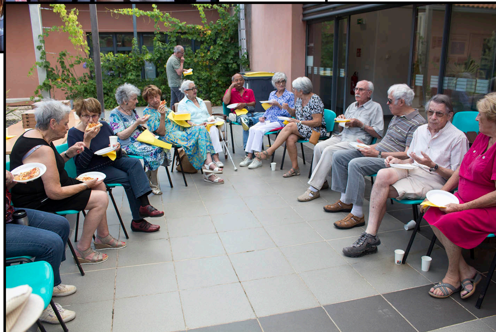
REPAS ANNUEL 2023