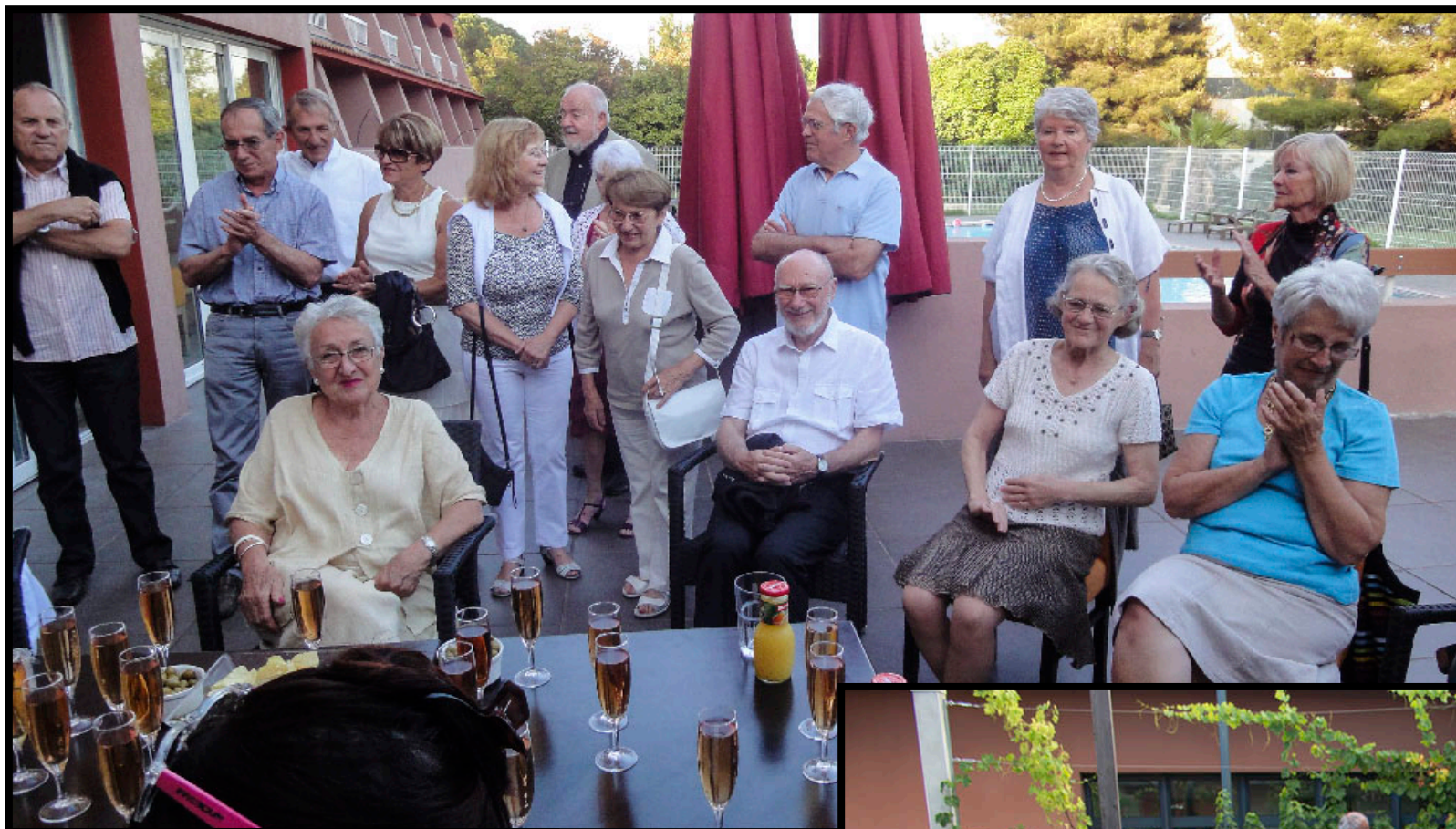
REPAS ANNUEL 2013